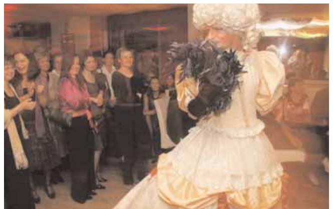
Po części oficjalnej goście bawili się na bankiecie.